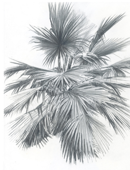
Palmera de jardín Grafito sobre papel Enmarcado en madera 39x45cm 520€ + IVA