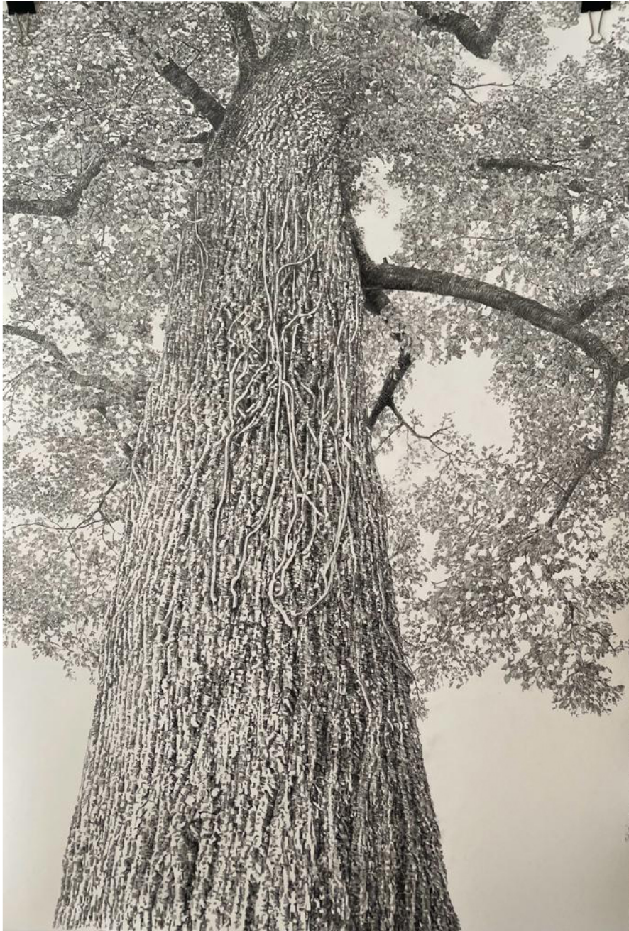
Tulipeiro de la Casa del Pasadizo. Braga Lápiz Conté sobre papel de acuarela 124x83,5cm 4000€ + IVA