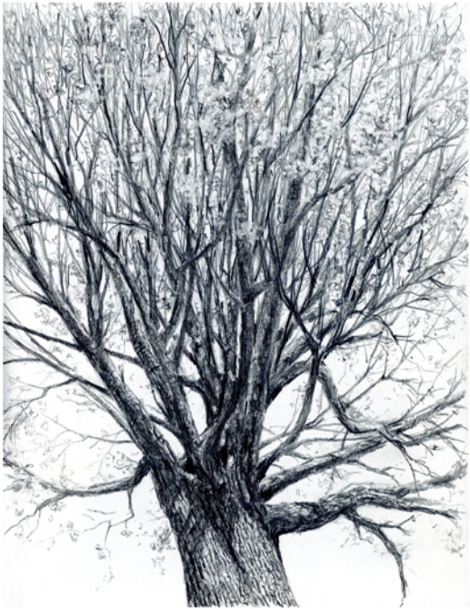
Del parque de palomera Grafito sobre papel Enmarcado en madera 39x45cm 520€ + IVA