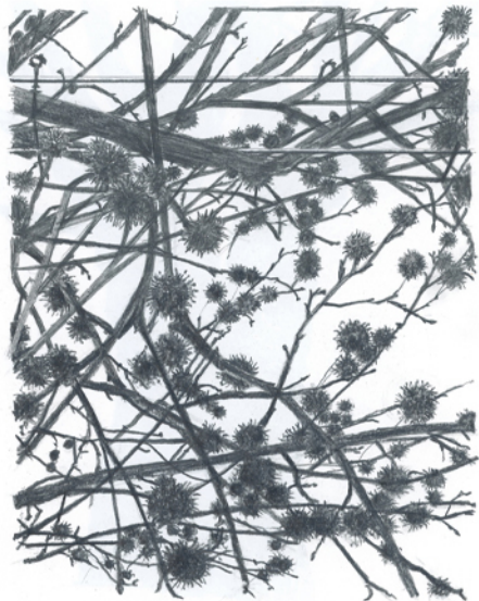
Composición de castañas Grafito sobre papel Enmarcado en madera 39x45cm 520€ + IVA