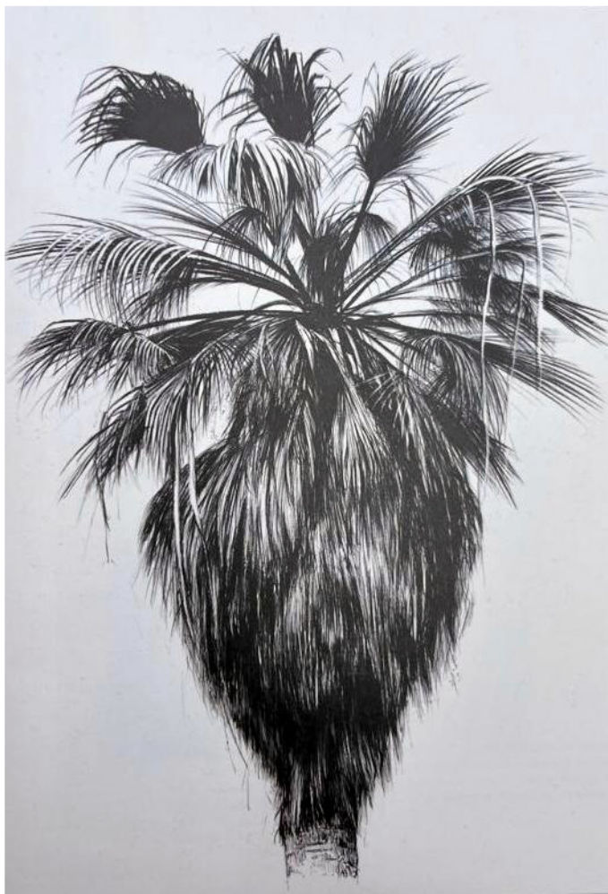
La primera palmera (Denia) Carbón graso sobre papel de acuarela Enmarcado en madera 112x76cm 4000€ + IVA