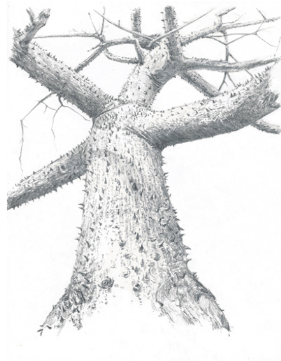
Ceiba espinosa II Grafito sobre papel Enmarcado en madera 39x45cm 520€ + IVA