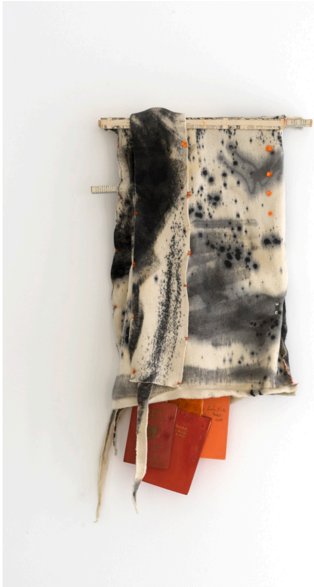
Carlos Sánchez Alonso “Palabras naranjas con vestido de cola” Lana pintada, cosida y libros 80 x 50 cm 1200€ + IVA