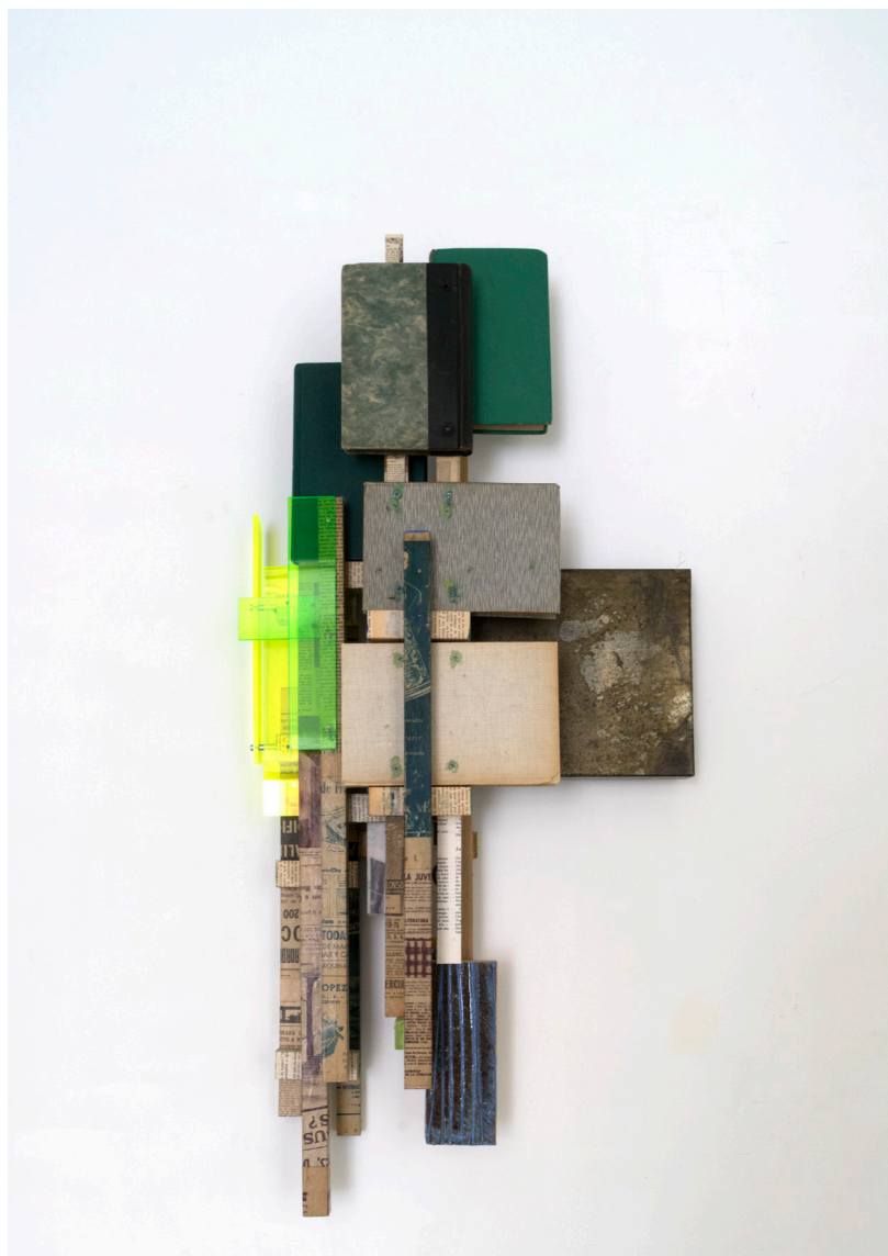
Carlos Sánchez Alonso "Palabras con sombras de colores" Maderas, libros, zinc y metacrilato fluorescente 110 x 50 cm 2800€ + IVA