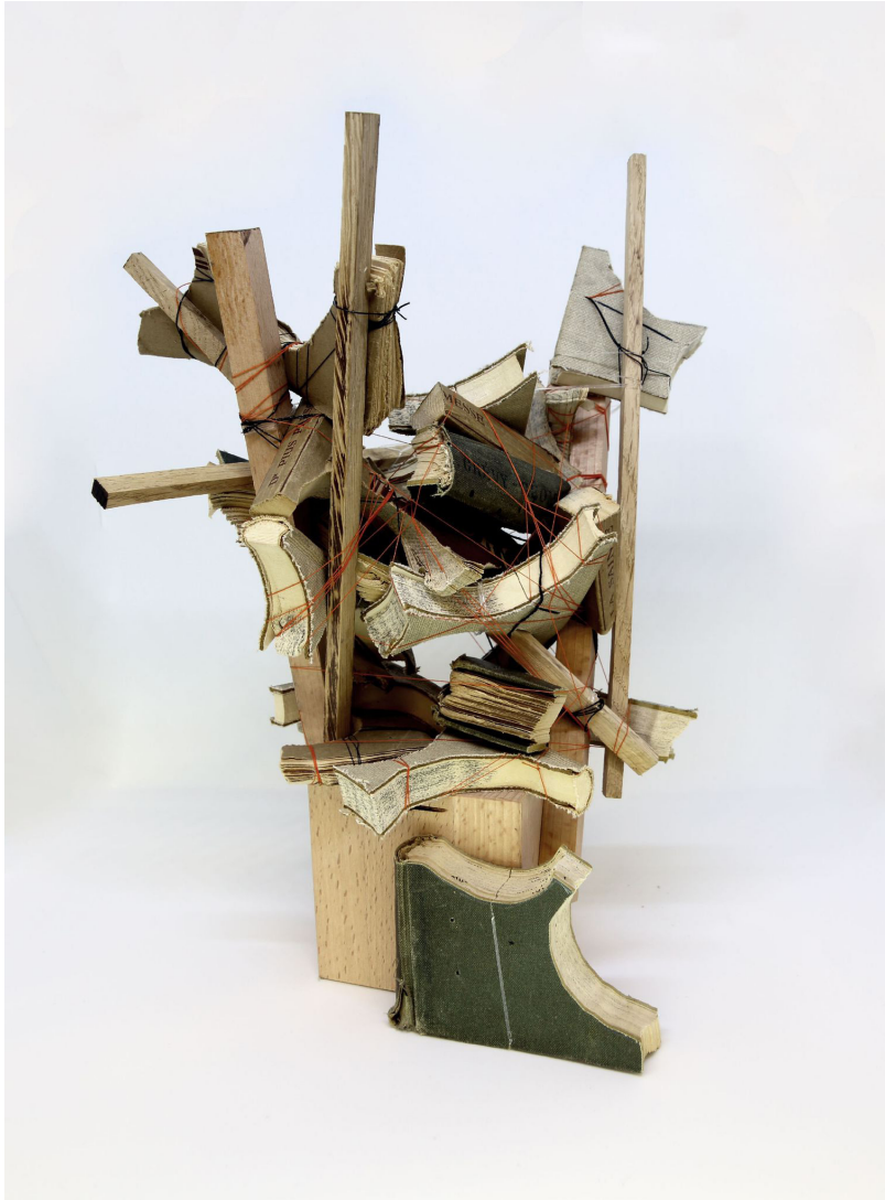
Carlos Sánchez Alonso "Restos de libros atados" Trozos de libros, madera y cuerda 600€+IVA