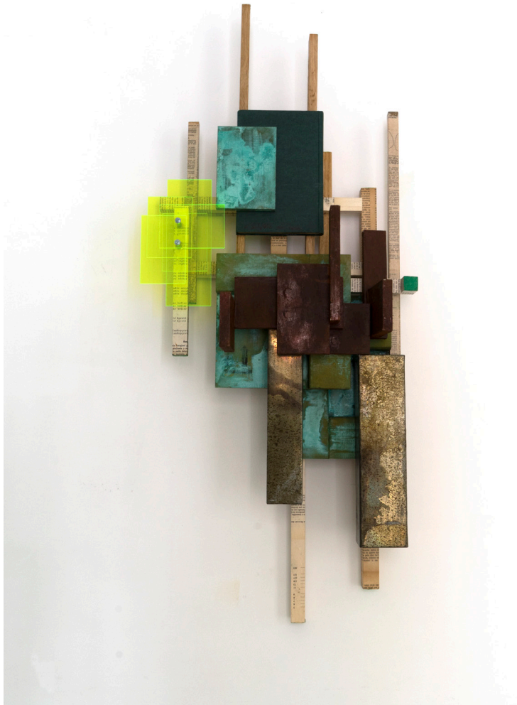
Carlos Sánchez Alonso "Palabras con sombras de colores" Maderas, libros, zinc y metacrilato fluorescente 110 x 50 cm 2800€ + IVA