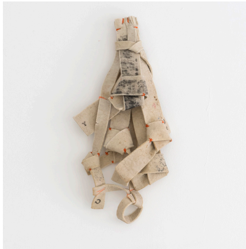
Carlos Sánchez Alonso Serie "Palabras atadas" Feltro manchado al estampar cosido y madera 600€ (IVA incluido)