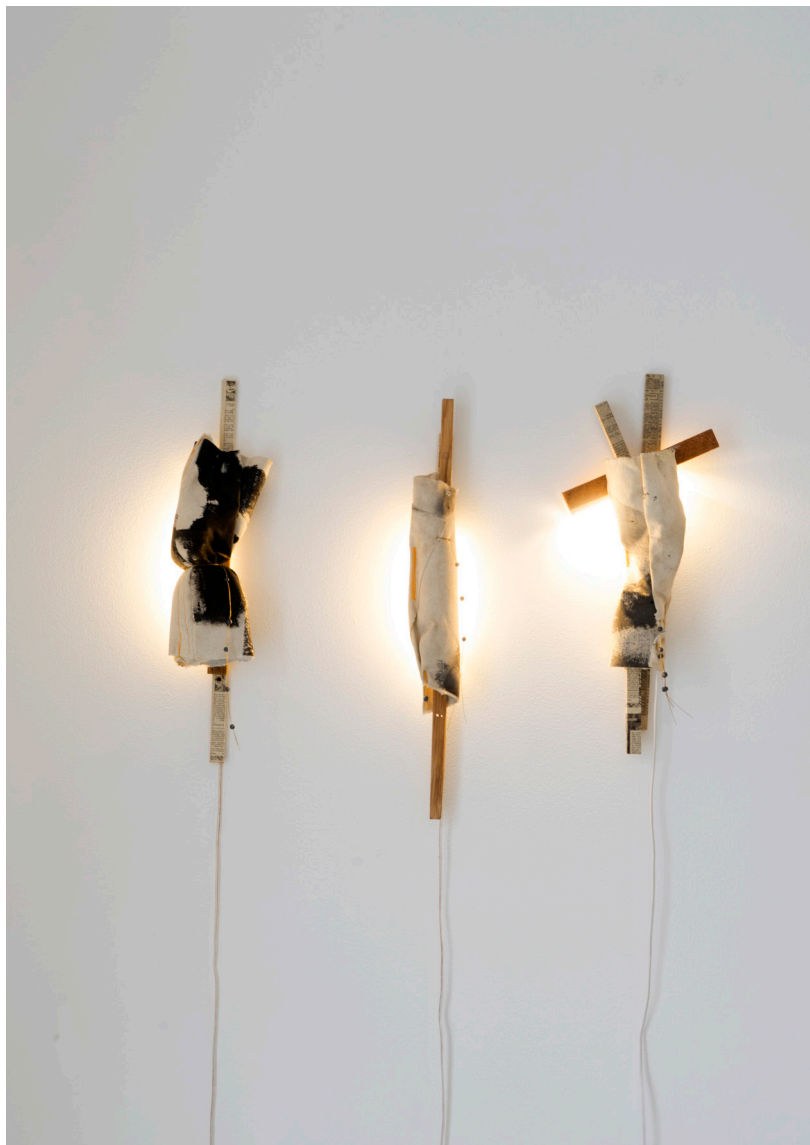
Carlos Sánchez Alonso Serie "Palabras muy elegantes" Tela pintada y cosida con madera, papel y luz 45 x 10 cm aprox. 600 € (IVA incluido)