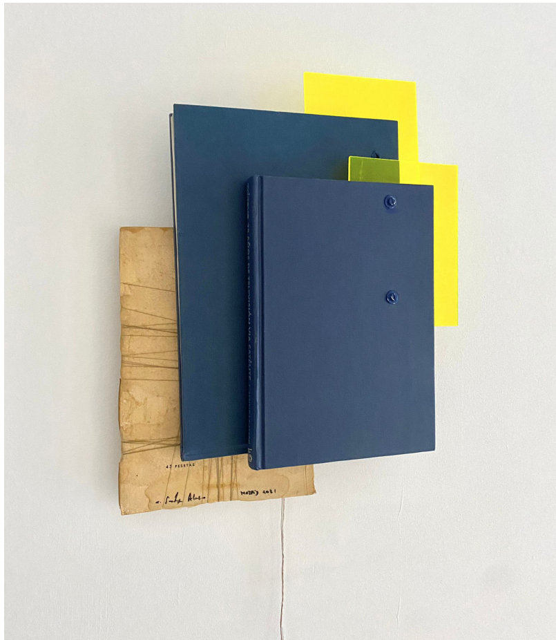
Carlos Sánchez Alonso “Desarquitectura de libros y luz” Libros, metacrilato fluorescente y luz 38x25x6cm 800€ + IVA